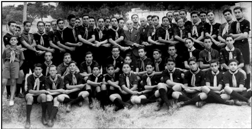
1938 Διάλυση Σώματος Προσκόπων από την δικτατορία Μεταξά. Στο κέντρο με κοστούμι ο Ιδρυτής Μ.Μ, δίπλα του ο Αθανάσιος Λευκαδίτης.