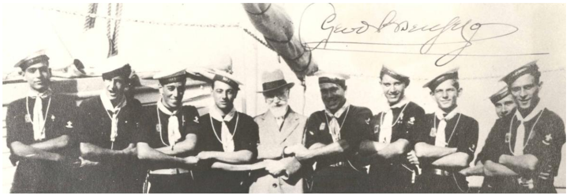
1931 με τον Ελευθέριο Βενιζέλο εν πλώ προς Τζάμπορη Παρισιού