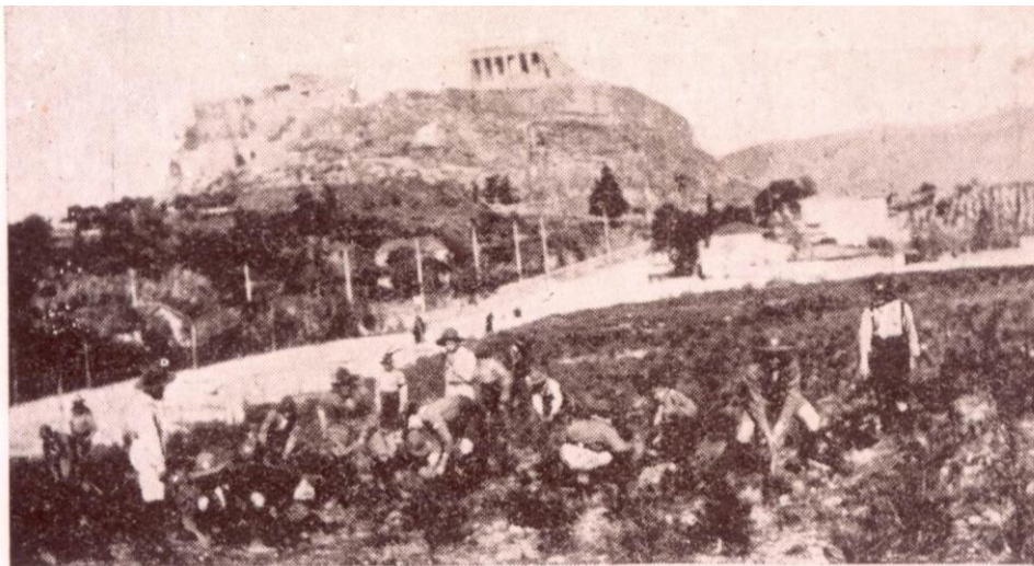
Φύτευσις ὑπὸ τῶν ὁμάδων Ἀθηνῶν μικρῶν πεύκων καὶ ἄλλων δενδρυλλίων εἰς τὴν κάτωθεν τοῦ Μνημείου τοῦ Φιλοπάππου χέρσον τότε (1916) ἔκτασιν, ἔνθα νῦν τὸ ὠραῖον πάρκον.