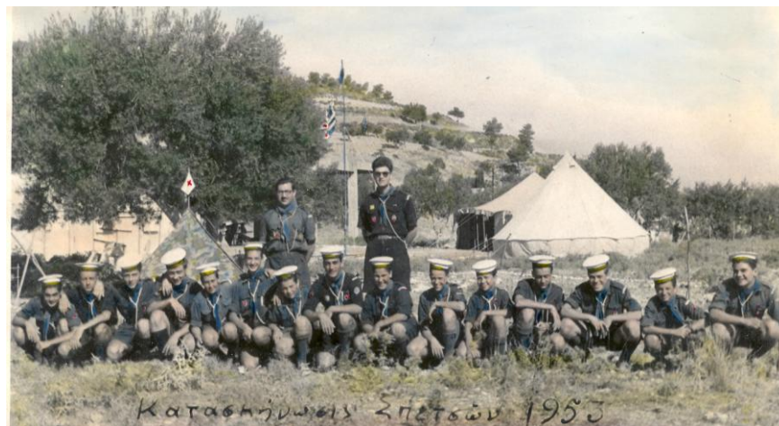
1953 Κατασκήνωση Σπετσών