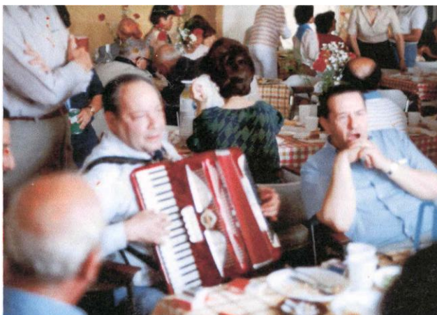
1983 Βάρη, γεύμα για Αγορά Λέσχης