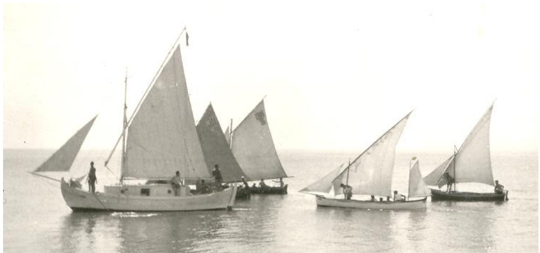
1932 ο στόλος της 3ης με το καϊκι Γλαύκη Ι