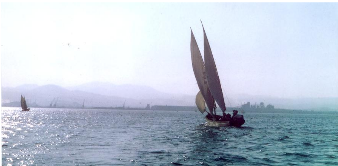
1971 Σχολή Κυβερνήτη Ναυτοπρόσκοπικού σκάφους με ξύλινες δεκάκωπες