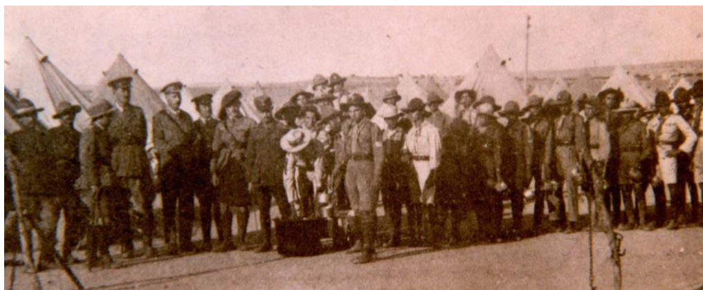
1917 Πυρκαγιά Θεσσαλονίκης. 6 Πρόσκοποι ἔχασαν τὴν ζωὴ τους.