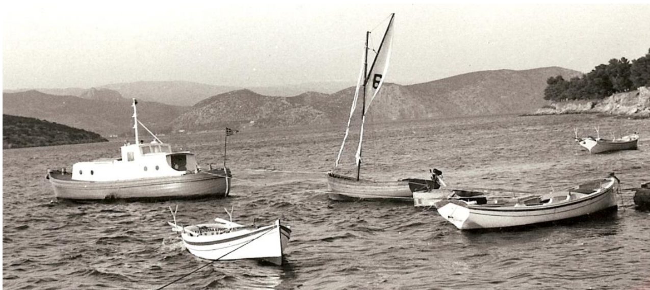
1976 Γλαύκη II και ξύλινη εξάκωπη ΣΕΠ 6