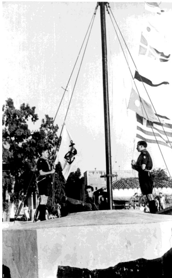
1949 στον Νεώσοικο της 3 ης