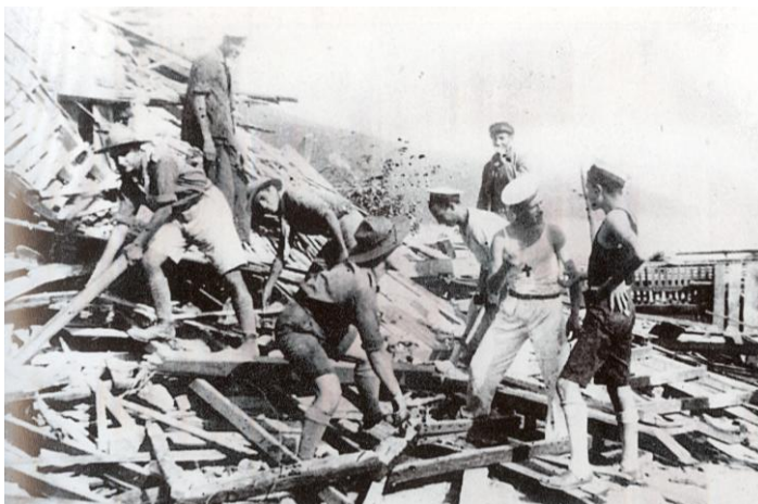
1933 Σεισμοί Κεφαλονιάς