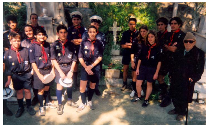
Ετήσιο Μνημόσυνο παλιών σε τάφο ΜΜ