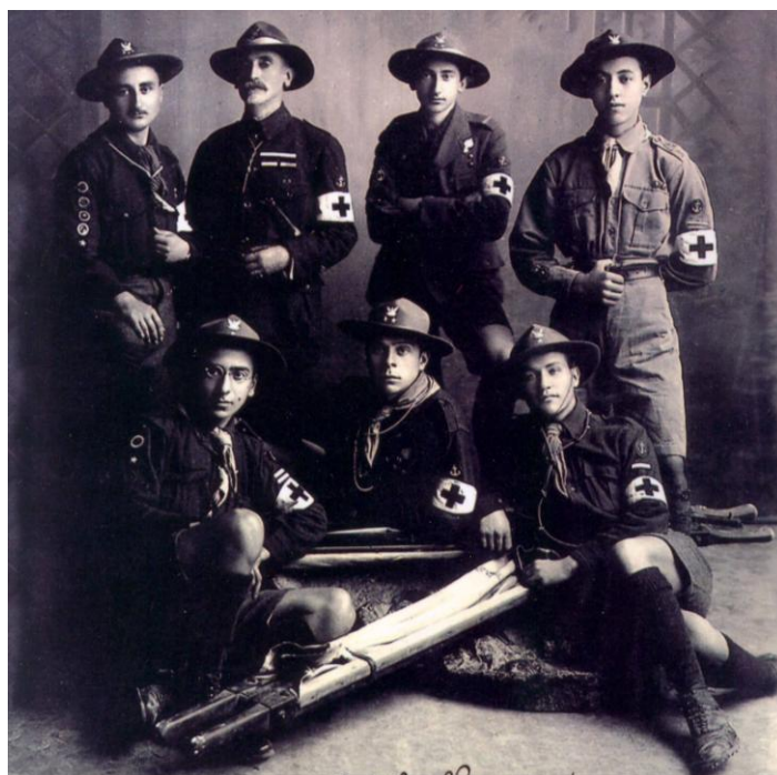
1916 Τραυματιοφορείς σε αιματηρά γεγονότα Αθήνας και Πειραιά