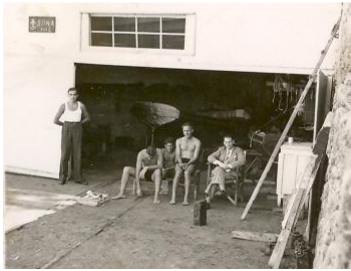
1938 ο Νεώσοικος στο Δέλτα