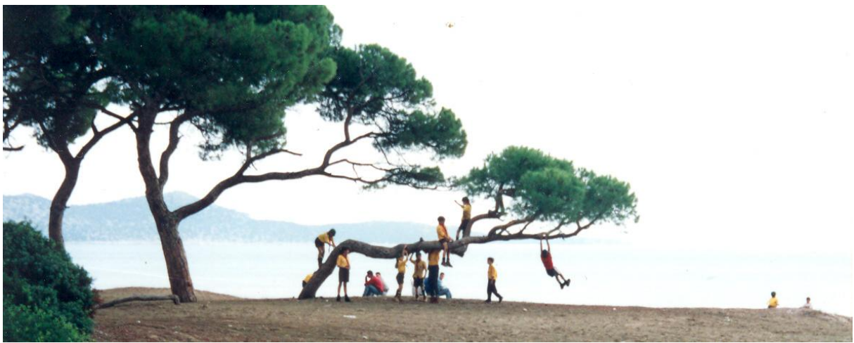
Η 3 η Αγέλη