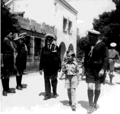
1947 με τον Διάδοχο