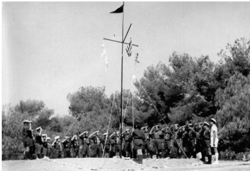
1958 η πρώτη Κατασκήνωση στην Ερμιόνη