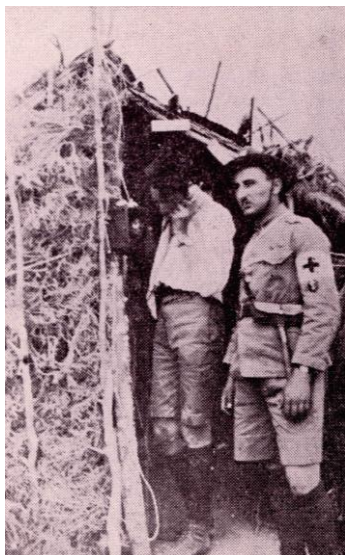
1918 Ακτοφυλακή στον Σαρωνικό κατά τον Πρώτο Παγκόσμιο πόλεμο