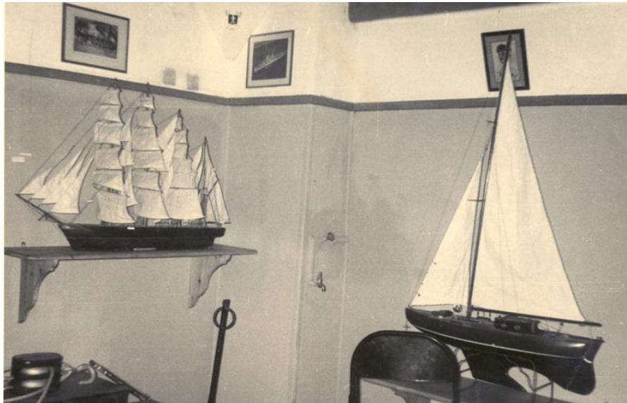
1960 Μοντέλλα πλοίων κατασκευασμένα από τους Ναυτοπρόσκόπους της 3ης