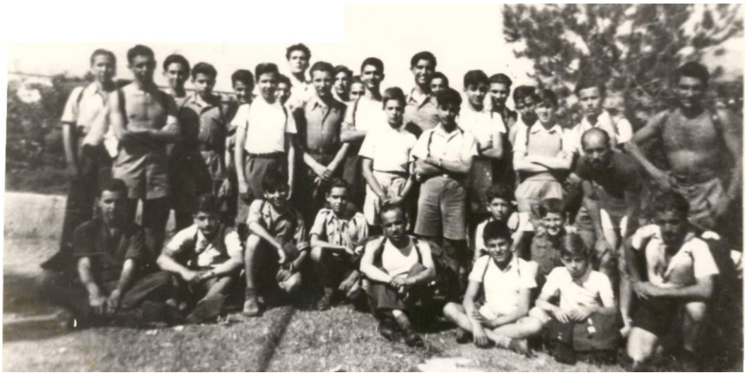
Εκδρομή (μάλλον στην Γλυφάδα) κατά την Κατοχή