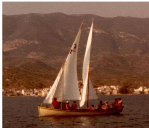
Ο «Μάρκος» φεύγει για την Ερμιόνη