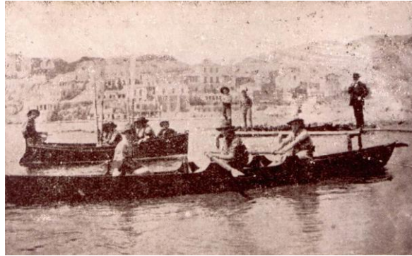
1913 κωπηλασία στο Φάληρο