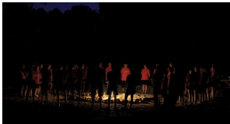
2009 Η μέρα πάει