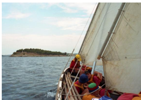
1981 η δεκάκωπη «Μάρκος Μίνδλερ» στην Ερμιόνη