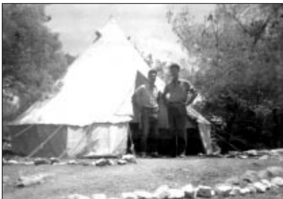
Ερμιόνη '58. Αρ. Καρτάλης, Δ. Μάγκος