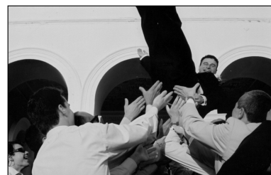
Το πατροπαράδοτο "έι-ωπ!" στον γαμπρό.