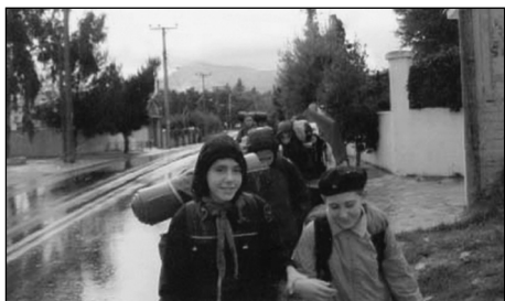
Από την εκδρομή στην Αγία Τριάδα.

Χαρακτηριστικές δράσεις, πέρα από τις κλασσικές εκδρομές στον Άγιο Μερκούριο και τον Σχοινιά, ήταν η εκδρομή στην Αγία Τριάδα στον Μαραθώνα που επισκεφτήκαμε μετά από τουλάχιστον δέκα χρόνια μιας και το μέρος είχε καεί αλλά και η μονοήμερη εκδρομή για σκι στον Παρνασσό για την οποία οι πρόσκοποι έδειξαν ιδιαίτερο ζήλο.