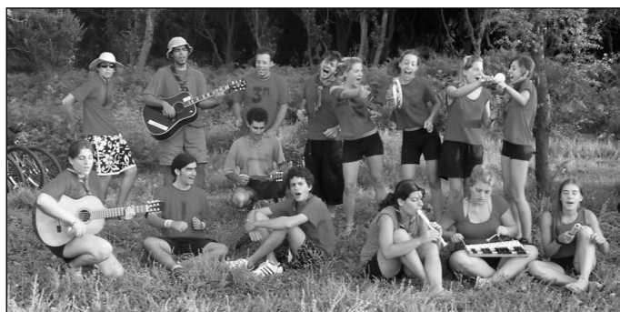
Στο camping της Σαμοθράκης.