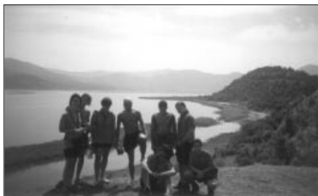
Κινητή Κατασκίνωση Κοινότητας, Μικρή Πρέσπα

• Κοινότητα: Παρά το γεγονός ότι όλοι σχεδόν οι Ανιχνευτές ήταν πέρσι μαθητές της Β' και Γ' Λυκείου και αφιέρωναν τα σαββατοκύριακά τους στα Φροντιστήρια, έγιναν αρκετές δράσεις. Οι σημαντικότερες ήταν η ποδηλατική εκδρομή στην Αίγινα, η συμμετοχή των Ανιχνευτών στις Ορειβατικές εκδρομές στα Πιέρια (Ιαν. '96) και στη Δίρφη (Δεκ. '96) και στις εκδρομές