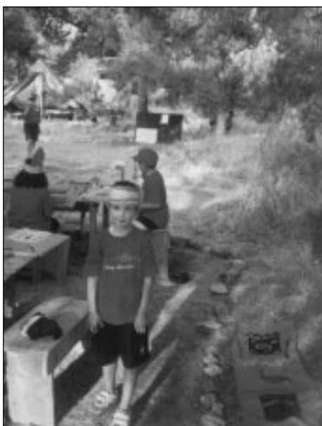
Στο Ινδιάνικο Χωριό της Αγέλης, Ερμιόνη '96