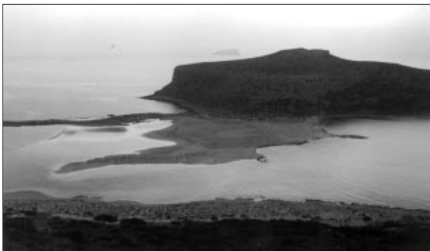
Παραλία Τηγάνι στη Γραμβούσα

Κατά κοινή ομολογία, η κατασκήνωση αυτή μας έδωσε αμέτρητες εμπειρίες και όλοι γυρίσαμε σόοι και σοφότεροι.