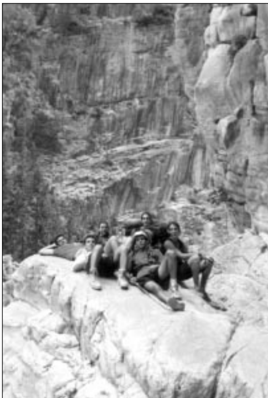
Από την κινητή κατασκήνωση της Κοινότητας στην Κρήτη